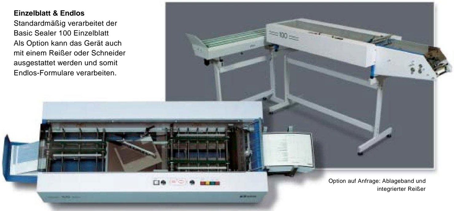
Option auf Anfrage: Ablageband und integrierter Reißer

Jedermann kann die Bedienung des „Office Sealers“ leicht erlernen. Es ist keine spezielle Schulung notwendig. Er hat eine Stauüberwachung entlang des Papierweges und ist mit dem Bedienfeld leicht zu überwachen.